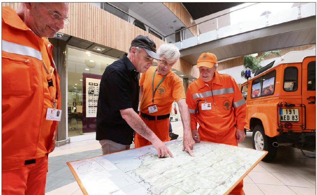
Le massif de l'Estérel fera, comme chaque été, l'objet d'une surveillance optimale.

« En conduisant dans un massif, ou en se baladant, il est strictement